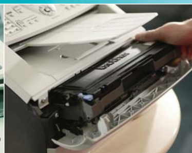
Раздельные тонер-картриджи и фотобарабан