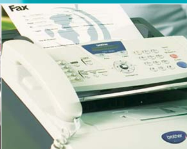
Встроенная телефонная трубка